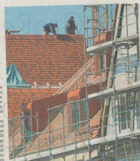
Die Bauinnung Regensburg hat sich die Bekämpfung der Schwarzarbeit auf die Fahnen geschrieben.